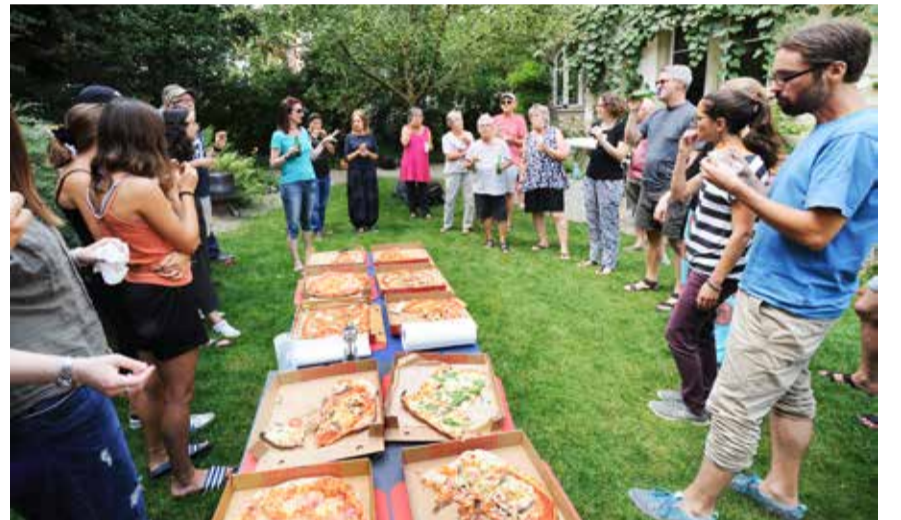
Pizzaessen in der Pause – eine Tradition so alt wie das Buskers selbst.