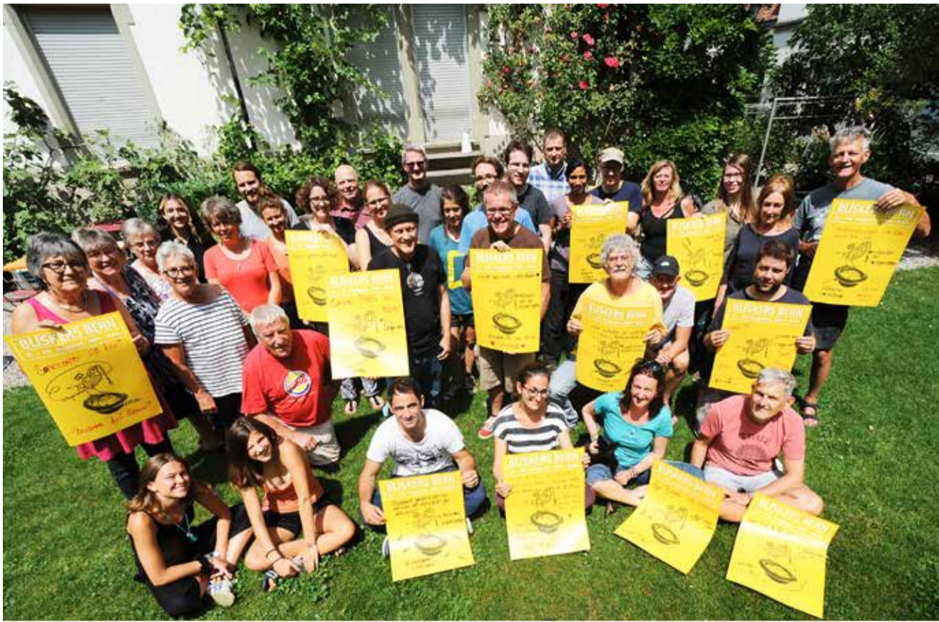
Jedem Tierchen sein Papierchen: Stolz zeigen die Buskers-Helferinnen- und Helfer ihre selbstdekorierten Festivalplakate .