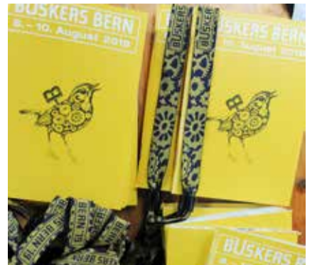
Das Programmheft des Buskers 2019 ist zum Verkauf bereit.