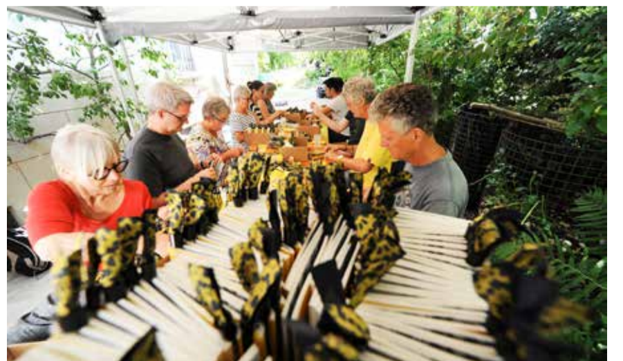
Um jedes Programmheft wird fein säuberlich ein Bändeli gewickelt.