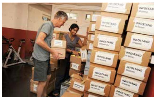
Die Bändeli und Programmhefte werden gestapelt.