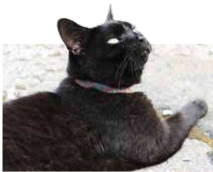
King Kong , die Buskers-Katze der ersten Stunde (hier mit Buskersbändeli)